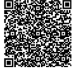
Loire Forez agglomération